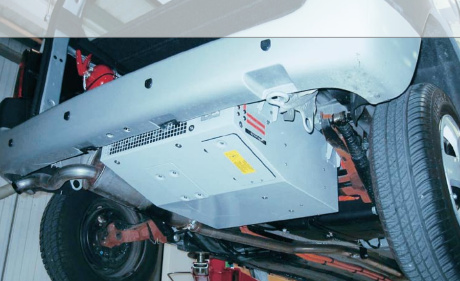
Integration eines Batteriepacks in ein Fahrzeug.