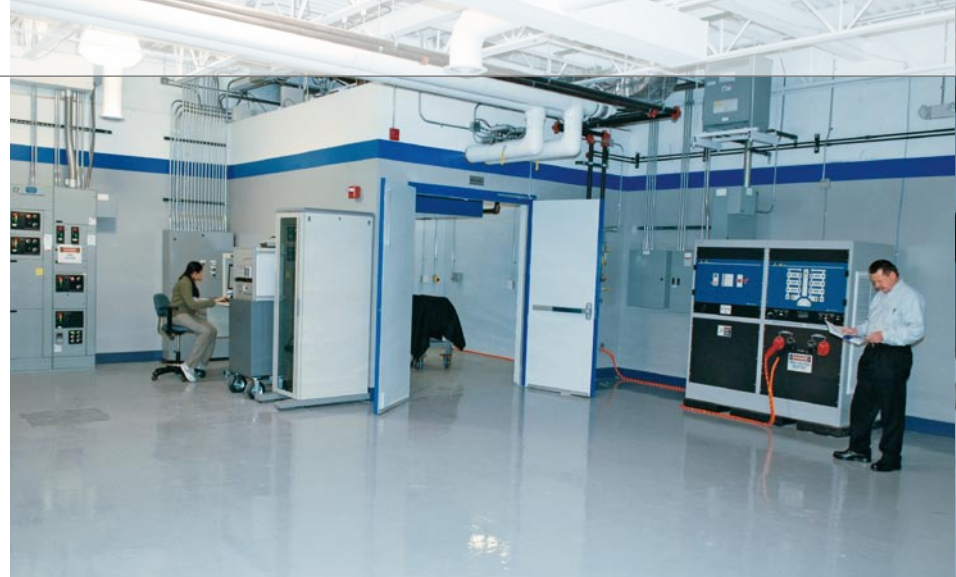
Die Testkammern verfügen über robuste Sicherheits- und Filtersysteme – ideal für die Arbeit mit Zellen und Packs, die nicht validierte Zusatzsysteme verwenden.

Das Zentrum bringt Experten verschiedenster Fachrichtungen (Konstruktion, Test etc.) zusammen und stellt außerdem die nötige Ausrüstung zur Verfügung. Heraus kommen Entwürfe vollintegrierter, schlüsselfertiger Batteriesysteme mit den dazugehörigen elektronischen Regelungssystemen. „In dieser hochmodernen Einrichtung werden Batterien über den gesamten Entwicklungsprozess hinweg evaluiert und optimiert – angefangen bei frühen Phasen über die Batteriepackproduktion bis hin zur